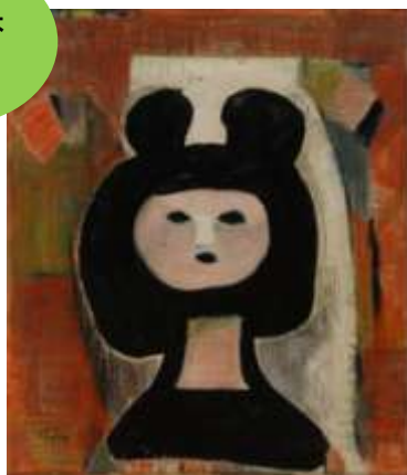
山口薫《あやこ節句》1954年