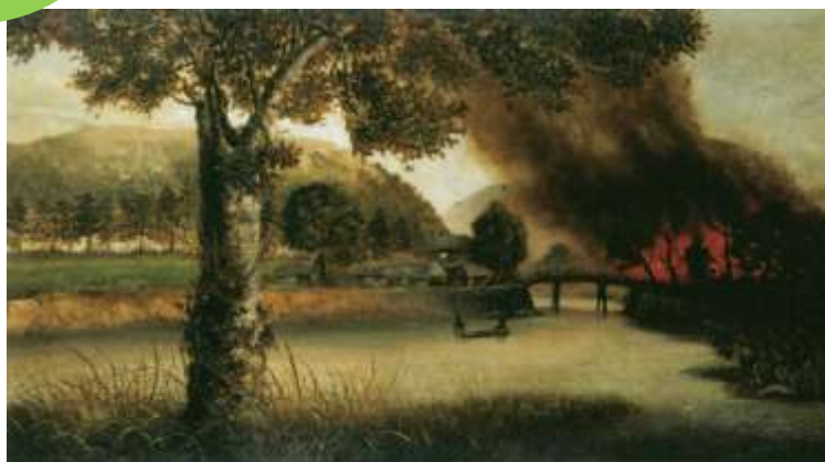
高橋由一《官軍が火を人吉に放つ図》1877年