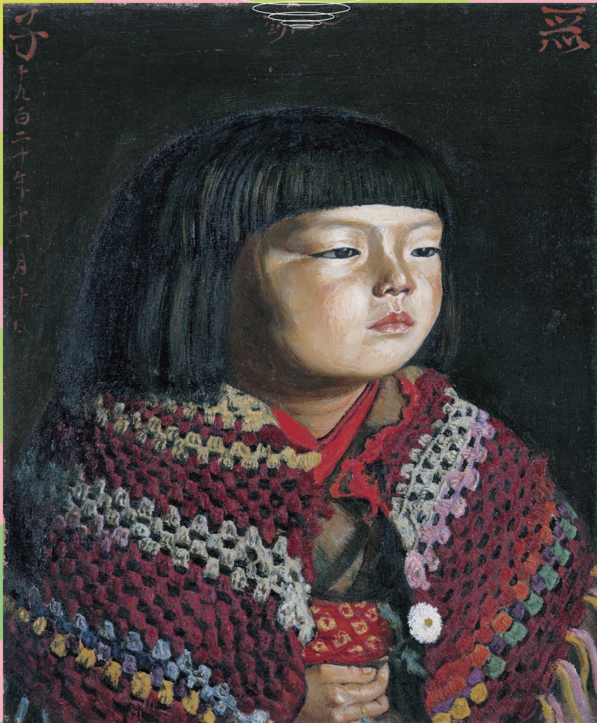
岸田劉生《毛糸肩掛せる麗子肖像》1920年

開館時間 | 10:00-17:00(入館は16:30まで) 休館日 | 毎週月曜日(ただし5/4は開館) 入館料 | ○一般 1,500(1,350)円 ○大学生 700(600)円 ○65歳以上 1,300円 ○障害者手帳をお持ちの方の同伴者1名 800円 ○高校生以下の方、障害者手帳をお持ちの方は無料 ※( )内は前売料金 ※有料入館者10人以上の団体割引あり ※学生・65歳以上の方は学生証または年齢の分かる身分証明書を提示ください ※65歳以上は前売り、当日券とも同じ料金 ※常設作品(マイセン磁器、幕末明治期の産摩鹿、ガラス作品)もご覧いただけます 前売券は、ローソン(Lコード 63122)、チケットぴあ(Pコード 687-399)にて販売 主催 | ウツドワン美術館、中国新聞社 後援 | 広島県、広島市教育委員会、廿日市市教育委員会、NHK広島放送局、中国放送、広島テレビ、 広島ホームテレビ、テレビ新広島、広島エフエム放送、FMちゅービー76.6MHz、FMはつかいち76.1MHz