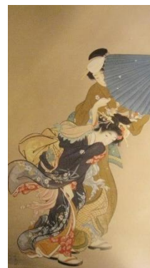
上村松園《雪吹美人図》1911年

美人画、花鳥画、風景画など、収蔵品の中から約80点を精選し、世界があこがれた日本の美を紹介します。※途中一部作品の入れ替えあり